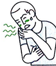
Vertiges / Nausées